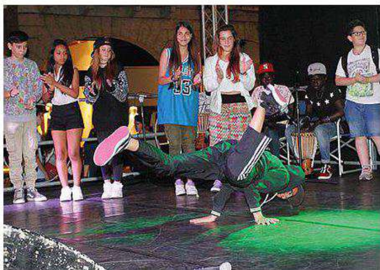
La scorsa edizione di Cantoeballosenzasballo